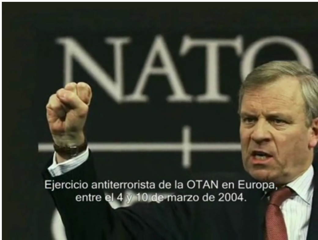
Ejercicio antiterrorista de la OTAN en Europa, entre el 4 y 10 de marzo de 2004.

"Con motivo del 6º aniversario de los trágicos sucesos del 11-M, desde Antimperialista hemos decidido reeditar el vídeo que hicieramos hace un año y medio titulado "Madrid 11M: 911 días después", inspirado, en su mayor parte, en las investigaciones realizadas por el colectivo antiimperialista Dek Unu. Nuestro propósito es rendir homenaje no sólo a las cientos de víctimas de Madrid, sino también a las que se pueden contar por millones en Oriente Medio, denunciando públicamente a los verdaderos autores intelectuales y materiales de los atentados: el integrísimo neoliberal y su brazo armado la OTAN; así como sus crueles intenciones: justificar la barbarie imperialista y el saqueo de las riquezas naturales de los pueblos árabes.